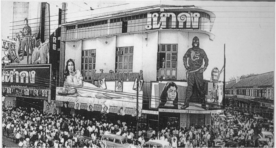
ภาพโรงภาพยนตร์เอ็มไพร์ พ.ศ.2501 (โดม สุวงศ์, สวัสดิ์ สุวรรณปักษ์ : ร้อยปีหนังไทย, 2545)

การเปลี่ยนแปลงของวิทยุกระจายเสียงและวิทยุโทรทัศน์ ถือเป็นการเปลี่ยนแปลงที่ผลักดันจากเจ้าของสถานีวิทยุหรือสถานีโทรทัศน์เป็นส่วนใหญ่ ผู้เกี่ยวข้องอื่นๆ ล้วนเป็นผู้ที่ต้องปฏิบัติตาม เพื่อเลือกสิ่งที่เหมาะสมที่สุดสำหรับการทำงานเพื่อผู้บริโภค โดยผู้บริโภคไม่สามารถเลือกเองได้ ซึ่งแตกต่างจากกิจการสิ่งพิมพ์และหนังสือพิมพ์ที่ผู้บริโภคหรือผู้ใช้บริการมีส่วนอย่างมากในการกำหนดการเปลี่ยนแปลงแต่ละครั้ง